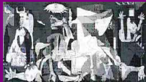
La violencia solo engendra más violencia

Siram Abif , más que un mito o leyenda, es un paradigma de genialidad, perseverancia, racionalidad y humanismo, que debería ser un ejemplo a seguir, no una exaltación al mito o leyenda, ni culto a la personalidad.